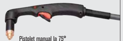
Pistol manual la 75°

(pentru mai multe tipuri de pistolete, consultați www.hypertherm.com )