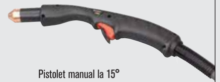
Pistol manual la 15°