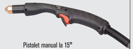
Pistol manual la 15°