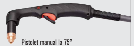
Pistol manual la 75°

(pentru mai multe tipuri de pistolete, consultați www.hypertherm.com )