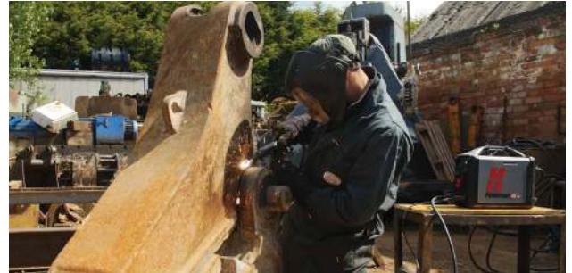
Întreținere și reparații