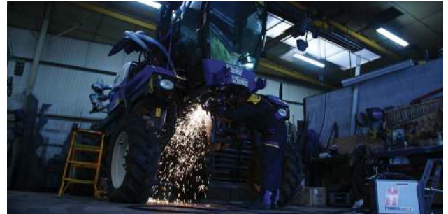
Întreținere echipamente agricole