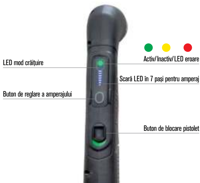
LED mod crățuire

Noile cartușe cu cod de culoare, montate prin răsucire pot fi schimbate în circa 10 secunde!