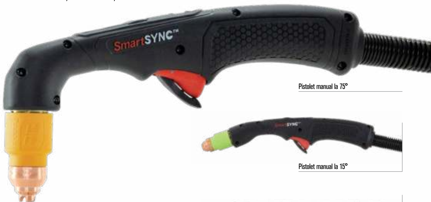
Pistol manual la 75°