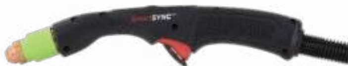
Pistol manual la 15°