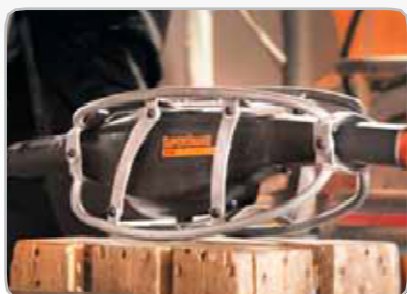
Cadru robust din oțel protejează eficient SuperSnake împotriva pericolelor de la locul de utilizare, precum lovituri și căderi.