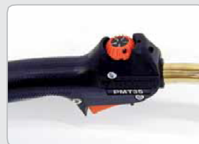
Când este conectat la echipamente Kemppi FastMig, SuperSnake este compatibil cu comanda de la distanță a pistolului RMT10, făcând gestionarea în timp real a puterii sau selecția canalului de la distanță ușoară și convenabilă.