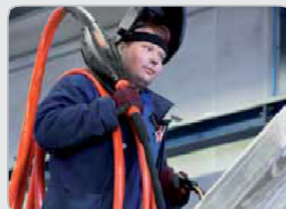
Eliberați-vă echipa de sudori oferindu-le mai multă libertate de mișcare.